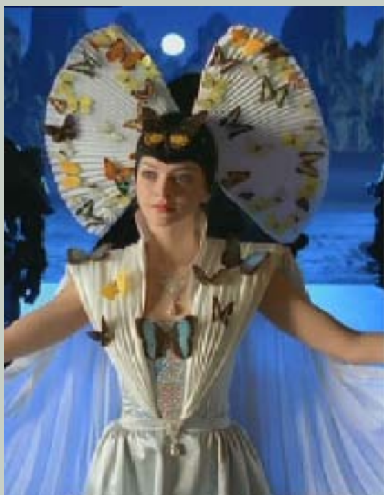
La comtesse Teeala Vandrone

A bord du NightFalcon, les deux maîtres jedis Adi Galia et Qui Gon Jin accompagnent nos héros sur Belsavis (Belsavis est une planète aux mains de plusieurs Maisons de nobles criminels, et ce, depuis des siècles. Belsavis est le siège du gouvernement du secteur Senex, une région de l'espace ne faisant pas partie de la République. Bien que moins étendu que l'espace Hutt, le secteur Senex rivalise de puissance avec les Hutts en ce qui concerne la maîtrise des activités illégales sur la Bordure Extérieure). Une gigantesque station spatiale orbite autour de la planète blanche Belsavis, véritable plaque tournante des trafics illégaux dans cette région de l'espace (les Seigneurs du Crime de Belsavis interdisent, pour des raisons de sécurité, aux étrangers d'atterrir sur leur planète ; le commerce s'effectue uniquement sur la station orbitale, où les Seigneurs du Crime prélèvent une taxe sur toutes les transactions. Tout peut se vendre et s'acheter sur cette station, y compris des clones).