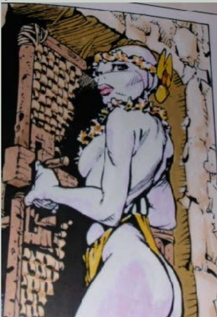
Mi-Nuee, la fille du chef Melkeïok

Description physique : ils ressemblent à des humains athlétiques à la peau bleue ; de larges branchies palpitantes s'ouvrent sur leurs cous, mais ils peuvent les obstruer complètement quand ils se trouvent à l'air libre.