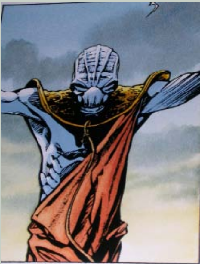
Le shaman Urukthapel...

High-level doctor, p.346 du core rulebook.