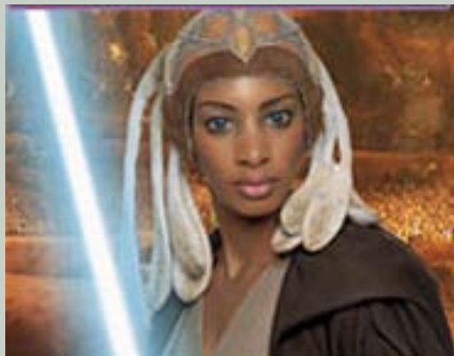
Maître Adi Galia en action...

bipodes blindés ouvrent le feu sur le village. Maître Adi Galia intervient alors, et a tôt fait de neutraliser les mercenaires. Les héros décident alors de se servir de la radio des véhicules pour attirer un vaisseau de mercenaires, et ainsi de capturer les membres de son équipage. L'opération est un succès (L'opération manque de coûter la vie à Xin, qui essuie un tir de blaster meurtrier. Arg se distingue par sa maladresse, ratant ses adversaires à bout portant dans la coursive étroite de la navette d'assaut), et l'équipe dispose bientôt d'une petite navette d'assaut, qui doit leur permettre de s'introduire dans la base principale du Consortium, sur Ouvéah