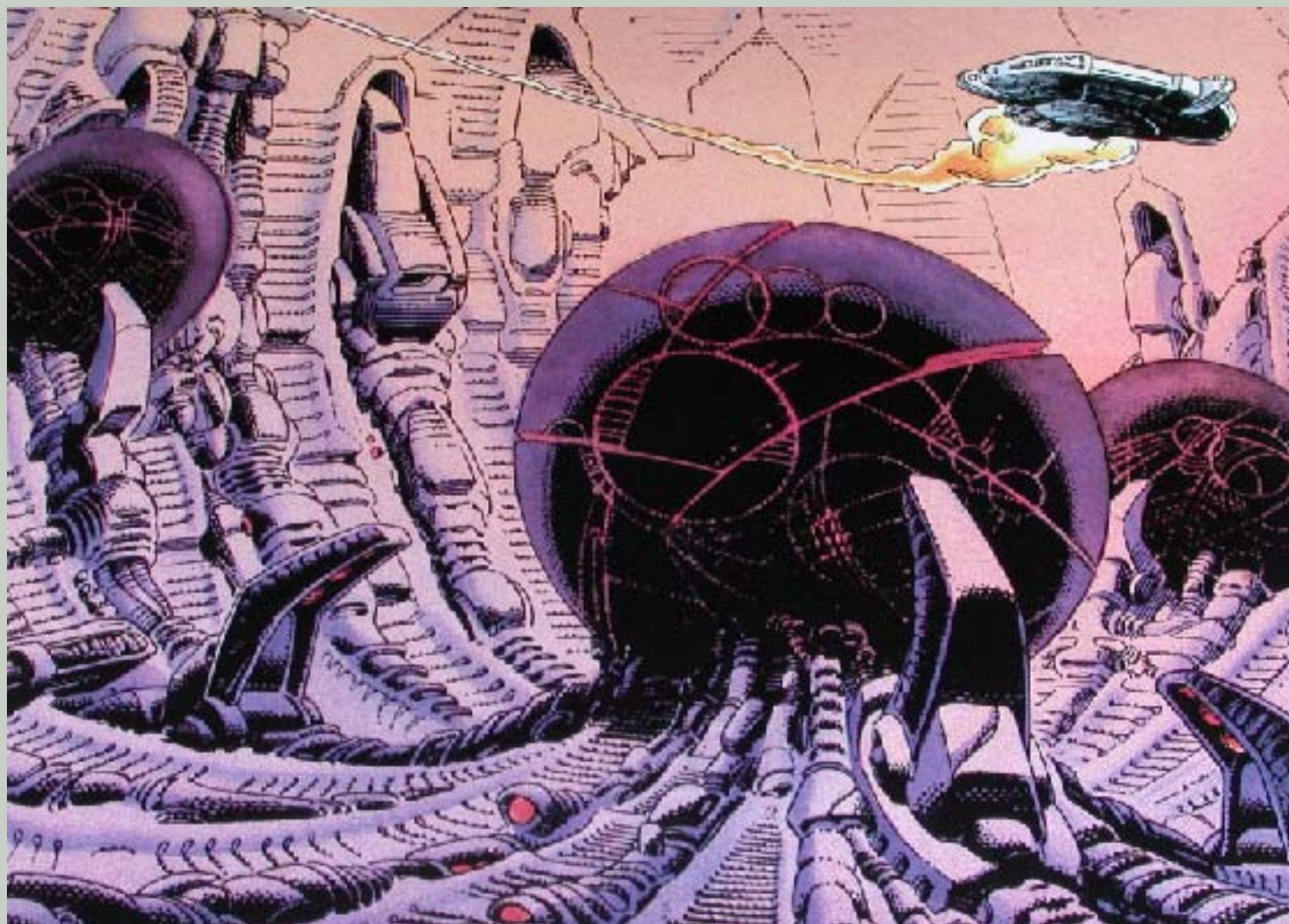
Les installations lunaires des Anciens d'Aquablue