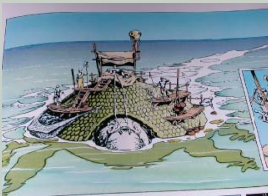
Une photo des indigènes d'Aquablue...

Epilogue : la mission envoyée sur Aquablue a rapporté des photos des indigènes, ainsi que des installations militaires et des usines importées sur la planète bleue par la société Rendili. Ces données sont suffisantes pour le Chancelier Suprême qui décide aussitôt d'entamer une procédure visant à sanctionner le Consortium et à stopper les sévices subis par les indigènes d'Aquablue. De plus, une commission d'enquête doit être envoyée sur Aquablue pour vérifier si la pollution écologique révélée par Jar Jar risque d'avoir d'importantes répercussions sur le mode de vie des indigènes.